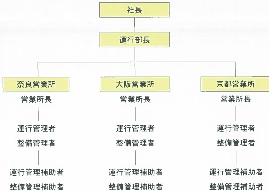
運輸の安全に関する管理指揮命令系統図